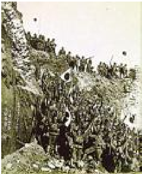
映画「南京の真実（仮題）」

◆ ご支援いただきました皆さまには、1口につき映画「南京の真実（仮題）」DVDを1枚進呈させていただきます。